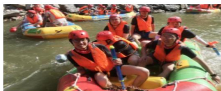
▲ 丰富的团 建活动