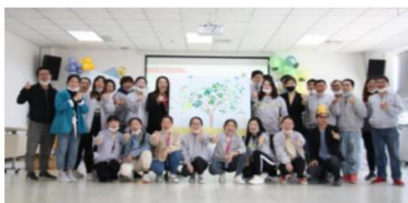
▲ 迎新 欢乐会