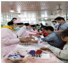
▲ 一年一度 体检福利